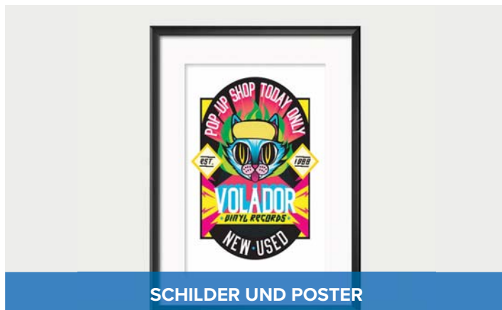
SCHILDER UND POSTER