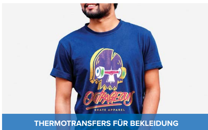
THERMOTRANSFERS FÜR BEKLEIDUNG